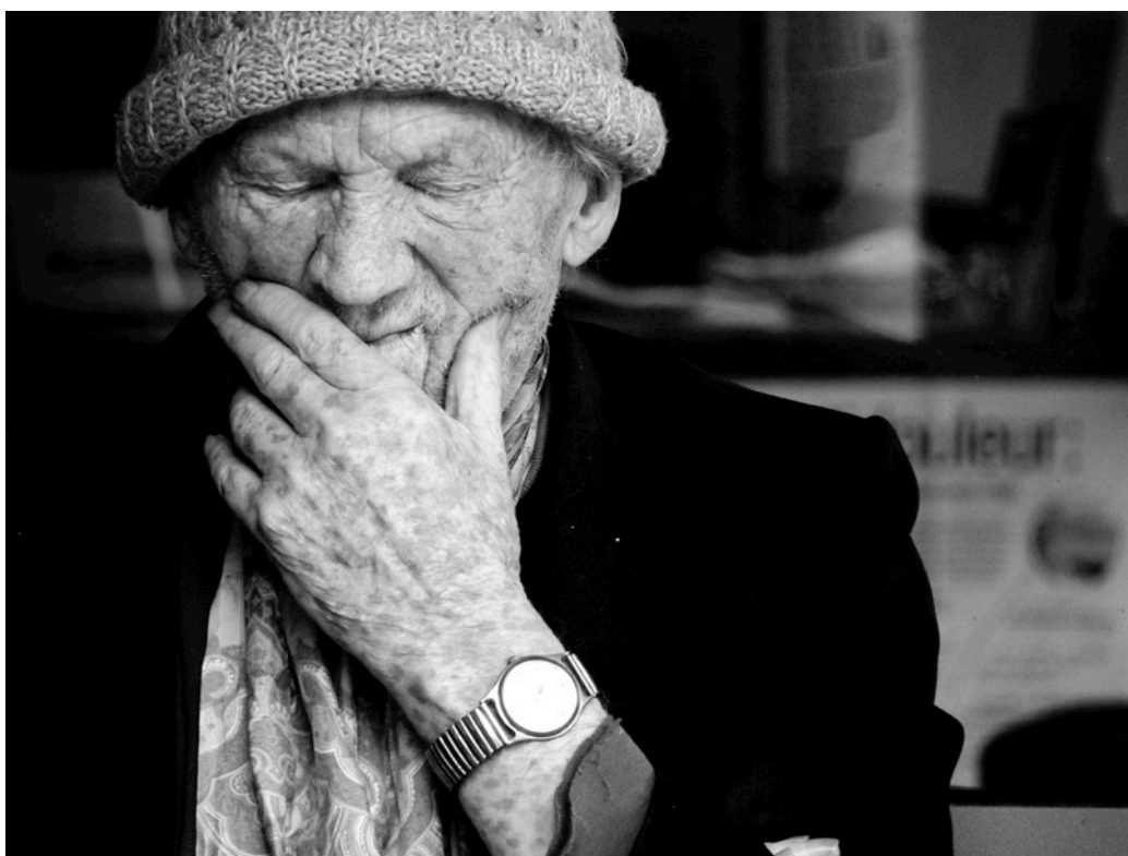
Maison de retraite de Château-Michel, Dieppe