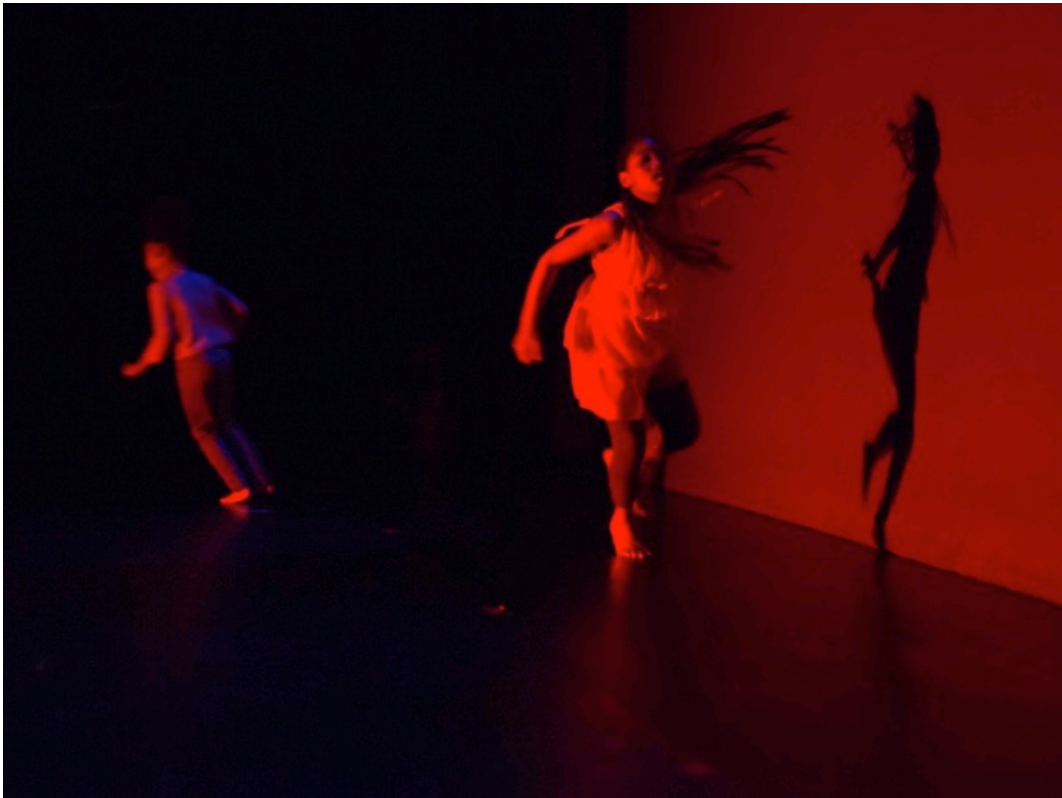
Atelier chorégraphique Jeanne Ragu - Théâtre Victor Hugo à Bagneux - 2016