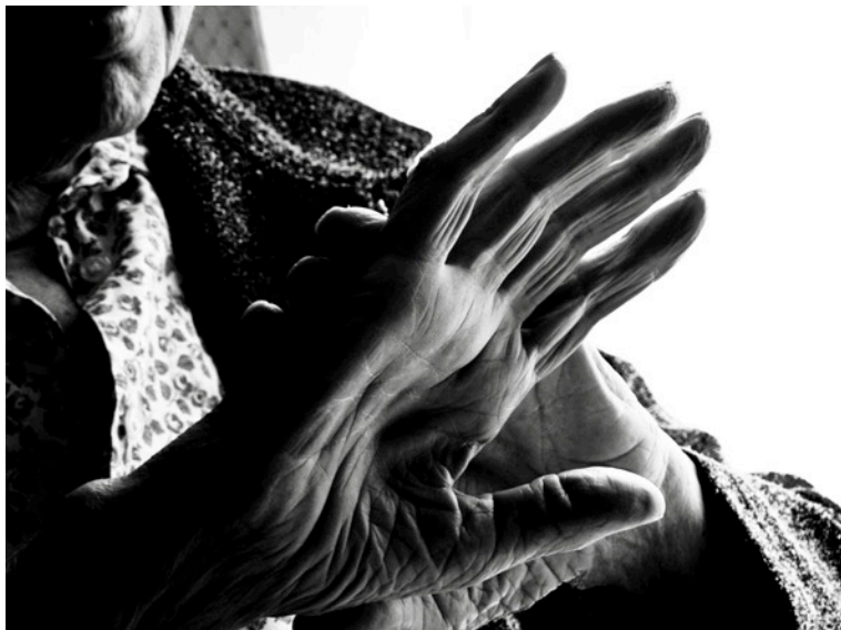
Maison de retraite de Château-Michel, Dieppe

La maison de retraite médicalisée « le Clos des Meuniers » se trouve au centre de la ville de Bagnaux, près des École Henri Wallon et Maurice Thorez où nous intervenons depuis deux ans. Cette maison possède une « unité protégée » pour malades d'Alzheimer.