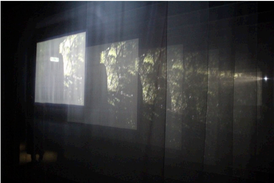
Bill Viola, The Veiling , 1995