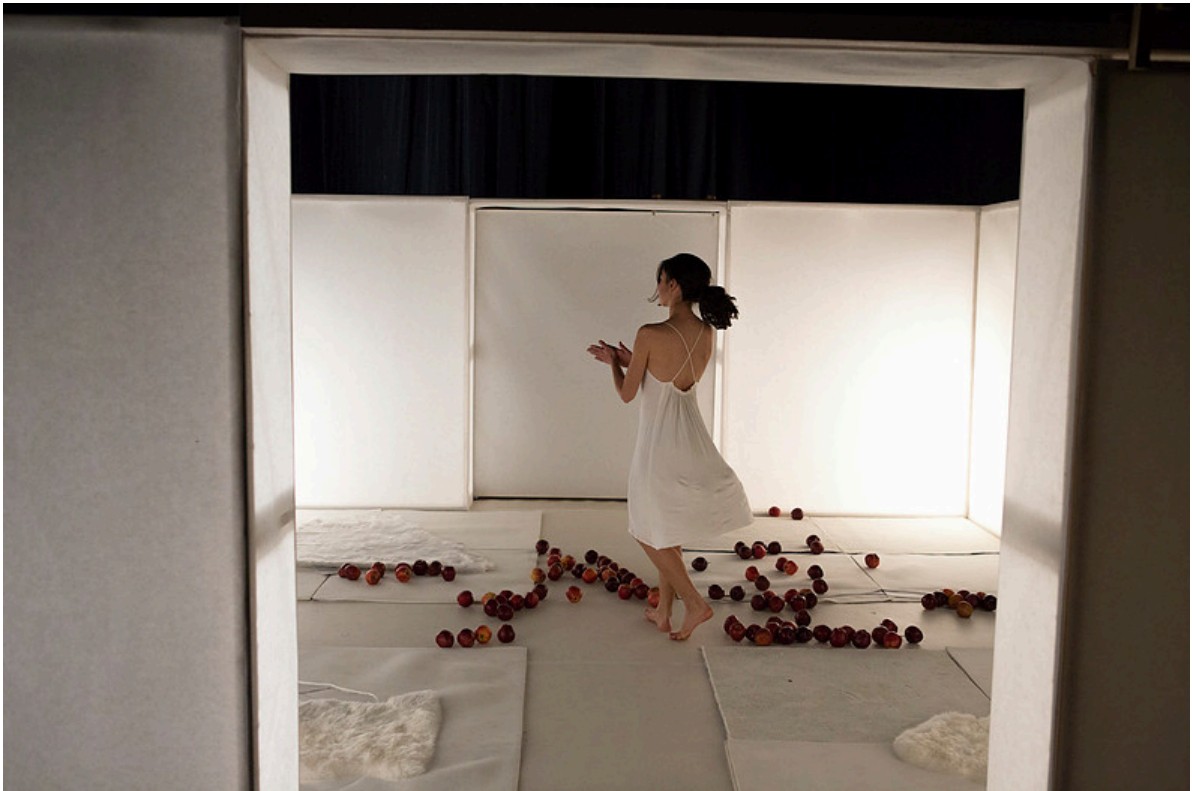
« Opus 1 - Blancs » de Daniela Labbé Cabrera et Aurélie Leroux - ©Franck Frappa